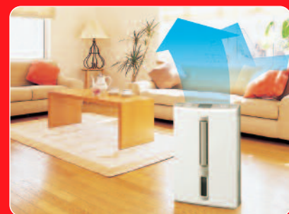
Opwaardse swing uitblaas