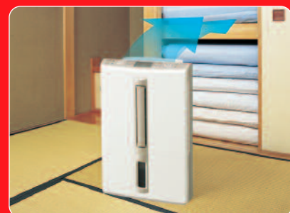
Achterwaardse swing uitblaas